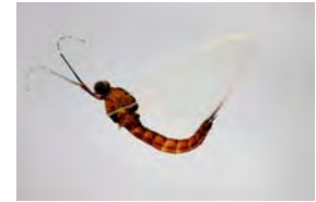
図 1. チラカゲロウ Isonychia japonica (♂)

チラカゲロウ Isonychia ( Isonychia ) japonica は、チラカゲロウ科 Isonychiidae に属する大型のカゲロウである（図 1; Ishiwata and Takemon, 2005). 体長 18 mm 程で、幼生の背部には正中線上に特徴的な黄白線がみられる。日本広域（北海道，本州，四国，九州）に分布するほか，朝鮮半島，中国，ロシアからも記録されている。河川の上流から下流までの比較的広い流程に分布している（Ishiwata and Takemon, 2005). チラカゲロウは，国交省による「河川水辺の国勢調査」においても高い出現率であることが認められている，いわゆる「普通種 ジェネラリスト」である。